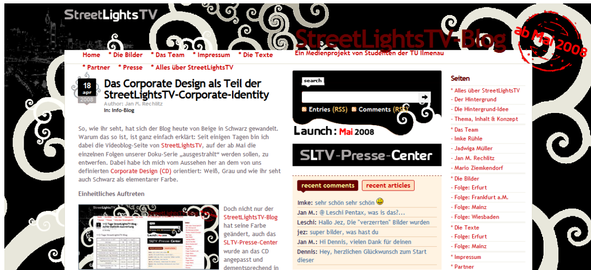
Abbildung des bestehenden Weblogs

Wenn Sie dieses innovative und erfolgsversprechende Projekt unterstützen möchten, gibt es die Möglichkeit, uns durch Sach- oder Geldspenden zu sponsorn.